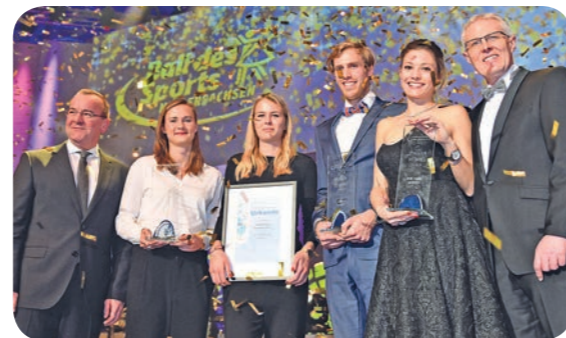
Ball des Sports 2018

Seit 2004 veranstaltet er die Niedersächsische Sportlerwahl in den Kategorien Sportlerin, Sportler und Mannschaft des Jahres und hat mit dem Ball des Sports Niedersachsen ein öffentlichkeitswirksames Ehrungsformat geschaffen. Für Nachwuchstalente gibt es die winnerparty in Zusammenarbeit mit der sj des LSB.